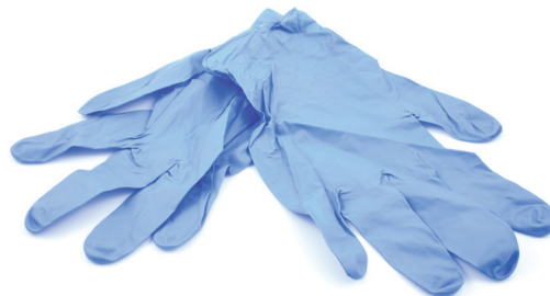
Imagen representativa únicamente. El color de los guantes puede ser diferente.

Katun tiene en cuenta el bienestar de su personal de servicio técnico, es por eso que nuestra oferta en productos de seguridad y cuidado personal son de alta calidad y buena reputación, incluyendo guantes de látex resistente change to: de varios tamaños y desinfectantes de manos.